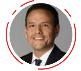
Cédric O Secrétaire d'État chargé de la Transition numérique et des Communications électroniques