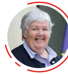
Jacqueline Gourault Ministre de la Cohésion des territoires et des Relations avec les collectivités territoriales